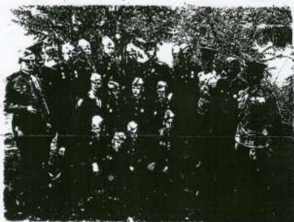
Меховићанин 1945 г. (Меховић пук, Меховић лине)