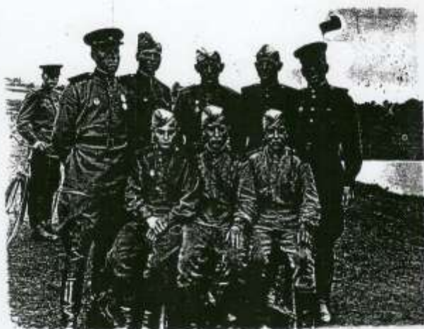
Меховићанин 1945 г. (Меховић пук, Меховић лине)